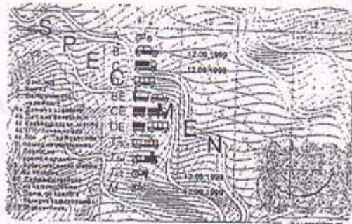
Modello formato card con ologramma romboidale. Rilasciato dal 1° gennaio 2000*