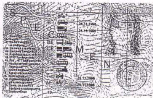
Modello formato card con ologramma circolare e riproduzione della fotografia del titolare sul retro. Rilasciato dal 1° ottobre 2002